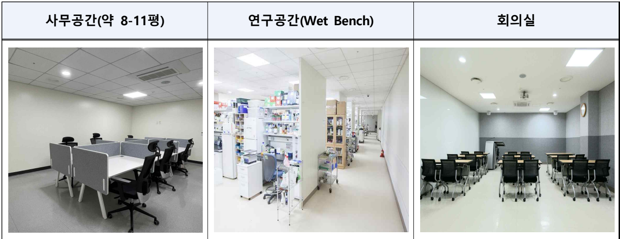
<사무공간 및 연구공간 사진>