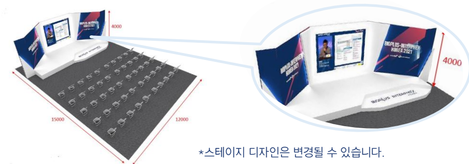
*스테이지 디자인은 변경될 수 있습니다.