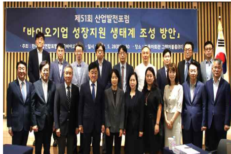
2024. 5. 28(화) / 자동차회관

창업 예정자, 바이오 기업의 초기 투자유치 역량 강화를 위한 IR 멘토링