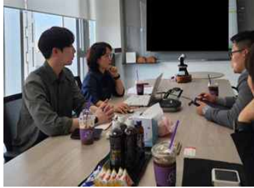
2024. 5. 21(화) / 미토이뮤테라퓨틱스