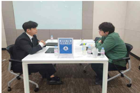
2024. 5. 23(목) / 스타트업캠퍼스

튀르키예 경제 현황 및 바이오 제약 분야 비즈니스 환경 정보, 비즈니스 협업 기회 제공