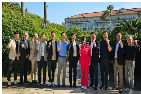
2024. 5. 9(목) ~ 5. 11(토) / 제주 신라호텔, 핑크스 골프 클럽