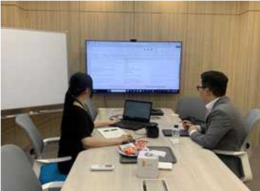
2024. 5. 28(화) / 코넥스트