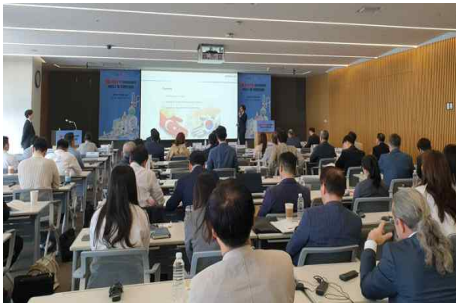
2024. 5. 9(목) / 트레이드타워