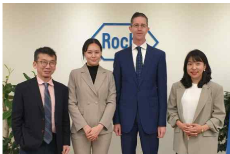
2024. 5. 7(화) / 한국 로슈 사무실