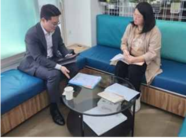
2024. 5. 8(수) / 다나그린