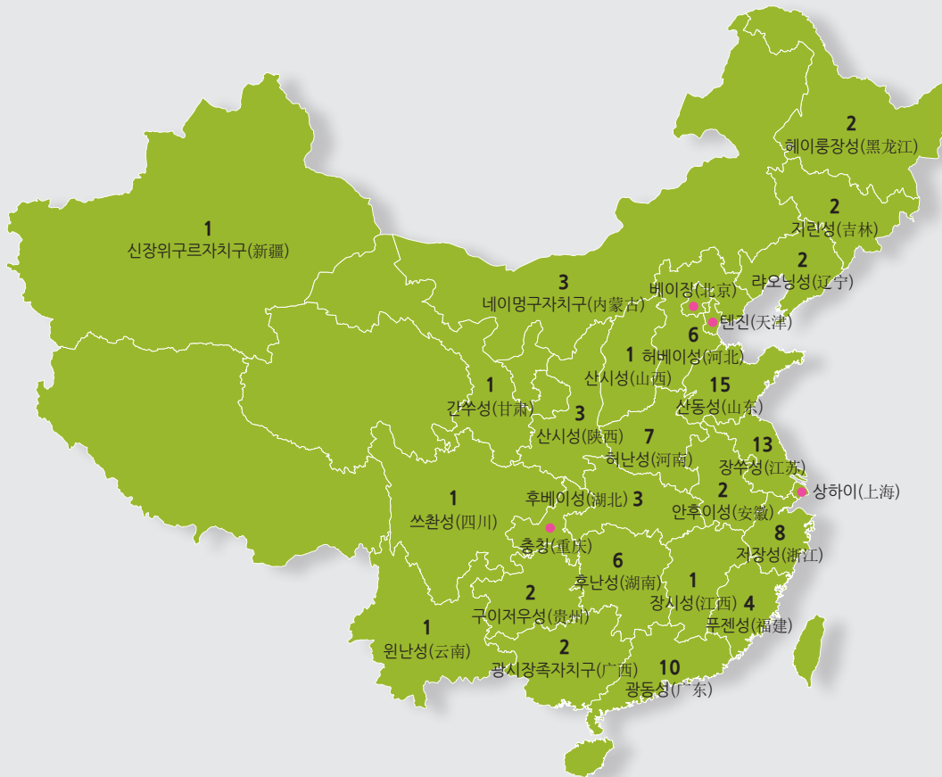
[그림 2] 2017년도 중국 지역별 GDP Top 100 도시의 수